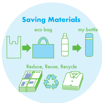
資源の有効利用など