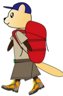
最近の高尾山山頂