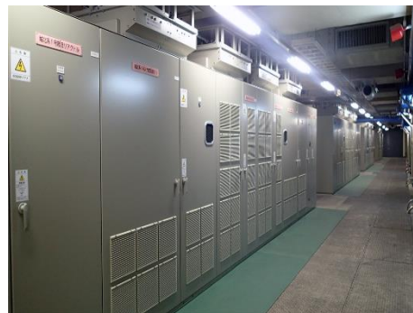
図1. 送配水ポンプ用インバータ装置