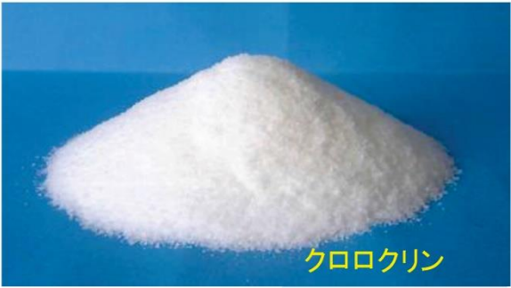
注入微生物栄養剤