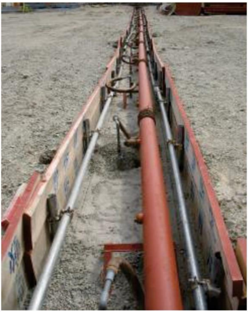
井戸設置例 (未供用地)