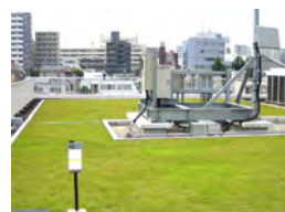
06 三井住建道路本社ビル