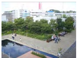
16 玉川高島屋ショッピングセンター