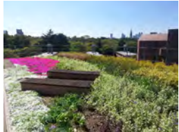
01 松田平田設計本社ビル