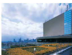
17 ホテルニューオータニ