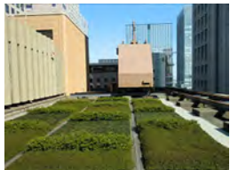
07 丸の内センタービル