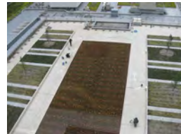
09 朝日生命大手町ビル