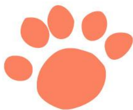
ハクビシンの足跡 (前あし)