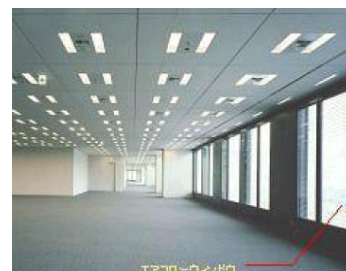
＜基準階 エアフローウィンドウ＞