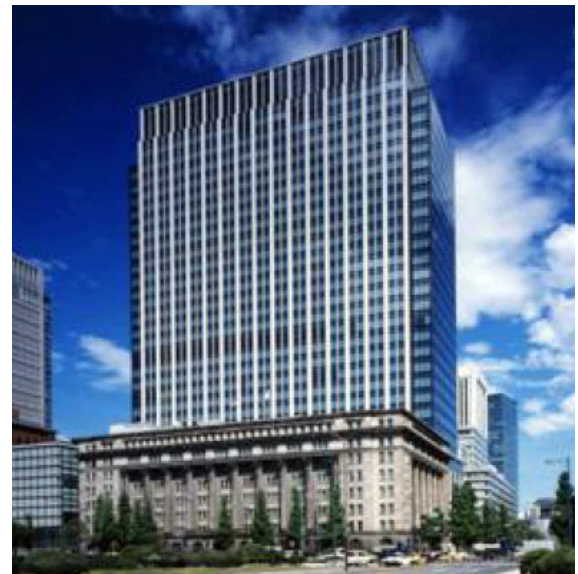
＜明治生命館(手前)と明治安田生命ビル＞