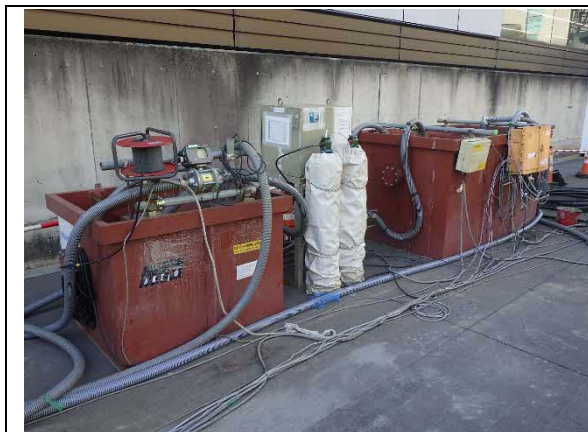
写真-1-1 工事排水の処理状況 (地点 01)