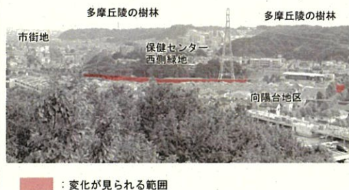
図 10.8-2(4) 代表的な眺望点からの眺望の状況(地点 4 : ファインタワー)

事業の実施に伴い、往復 4 車線の計画道路が出現し、眺望に変化が生じますが、現況道路地盤とほぼ同一高さで整備し、視点は道路を横断方向に視認する位置にあり距離があるため、現況の眺望景観からの変化はわずかです。