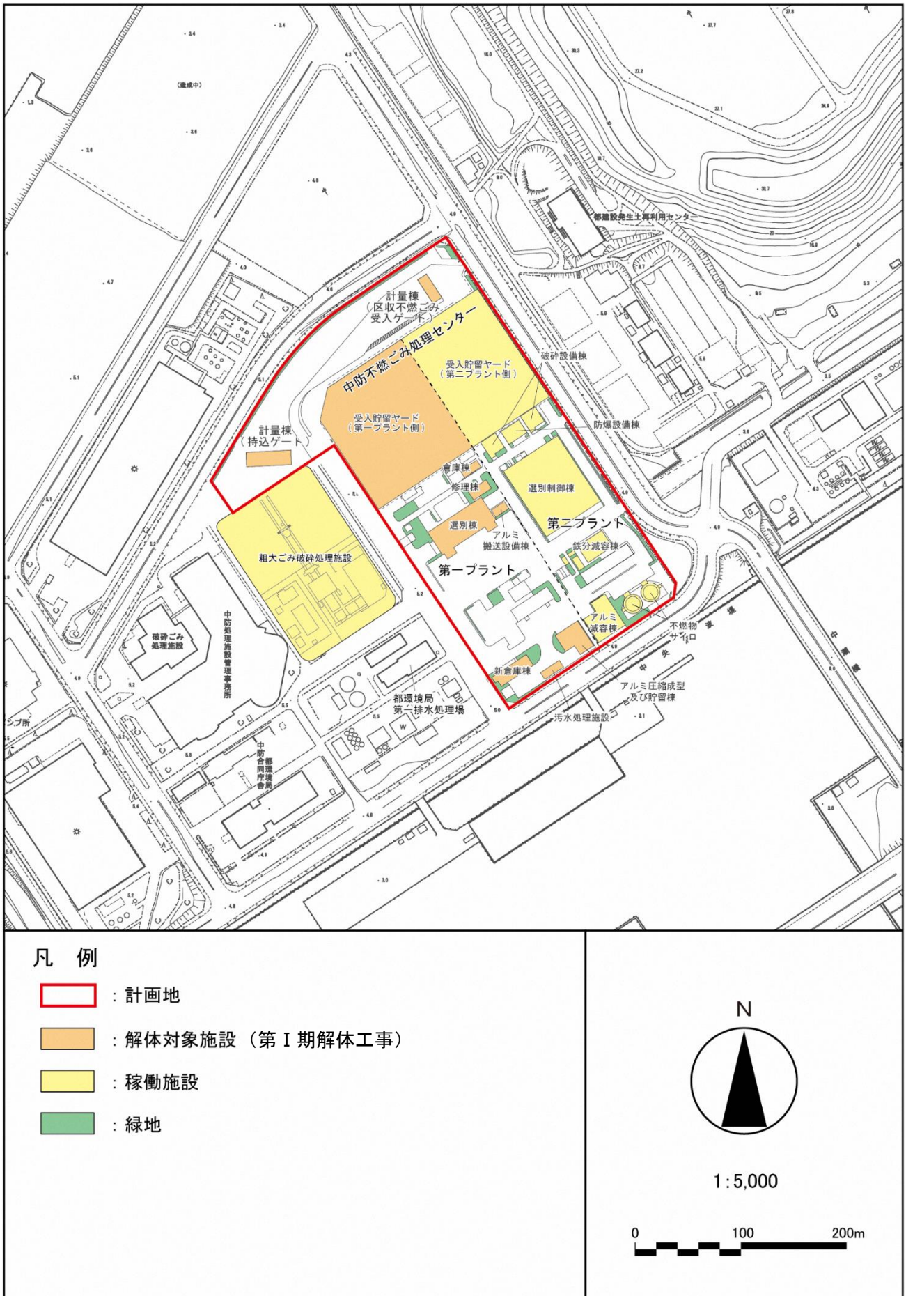
図 6.2-4(2) 施設配置図 (工事着工時)