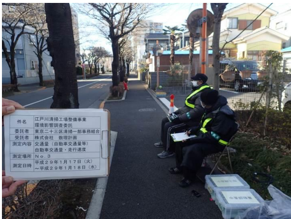
下鎌田東小学校前 地点3