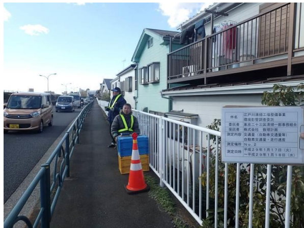
そよかぜひろば西 地点2