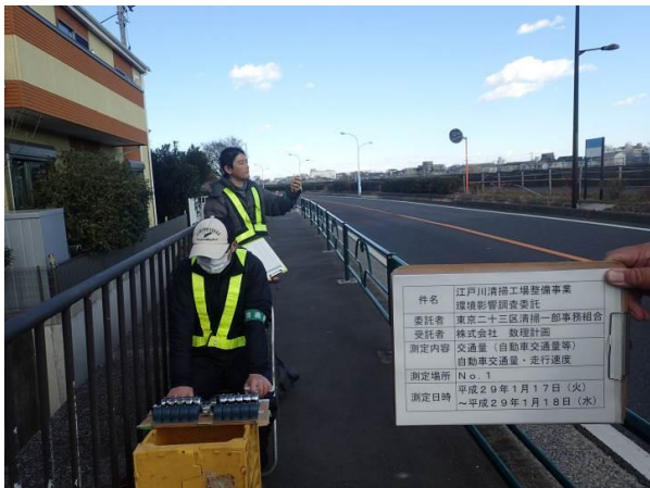
江戸川小学校付近 地点1