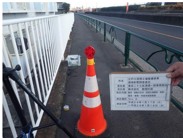
そよかぜひろば西 地点2