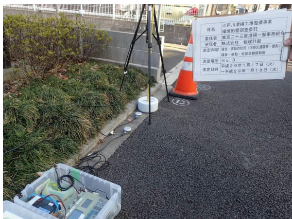
下鎌田東小学校前 地点3