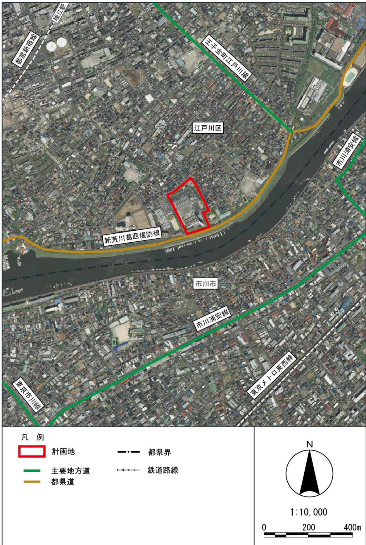
図 6.2-2 上空から見た対象事業の位置