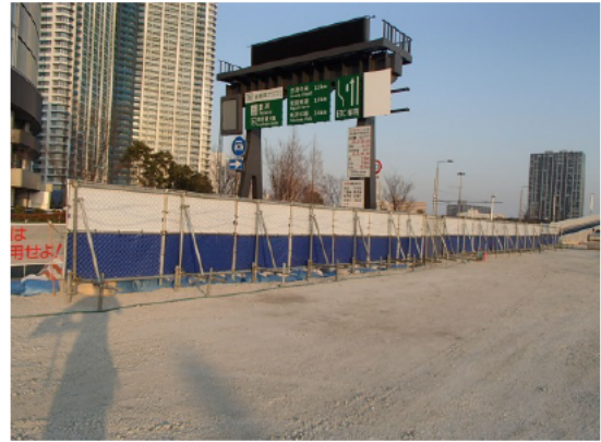
写真 3-8 環境保全のための措置の実施状況 (防じんネット付きの仮囲い 2)