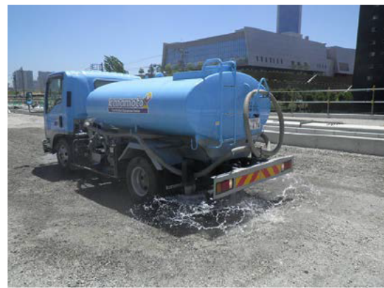
写真 3-10 環境保全のための措置の実施状況 (現場内散水 1)