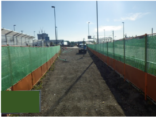
写真 3-7 環境保全のための措置の実施状況 (防じんネット付きの仮囲い 1)