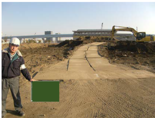
写真 3-9 環境保全のための措置の実施状況 (鉄板敷き)