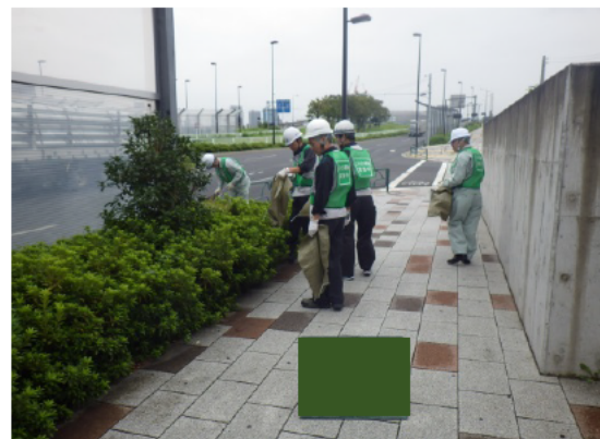
写真 3-12 環境保全のための措置の実施状況 (周辺における清掃)