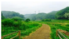
横沢入里山保全地域