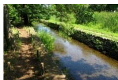
矢川緑地保全地域