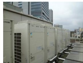
【高効率パッケージ空調機】

共用部照明のフロアごとの管理 便座ヒーターの温度の季節別設定 事務用機器を業務終了後に停止