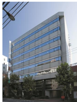
建物外観写真 (NOF高輪ビル)

名称: NOF高輪ビル 所在地: 品川区東五反田2-20-4 施工: 株式会社フジタ 設計: 安宅エンジニアリング株式会社 事業者等: 野村不動産マスターファンド投資法人 野村不動産投資顧問株式会社 竣工: 1993年4月 建物構造: S造 地上8階 延床面積: 4,764m 2