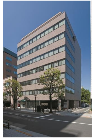
建物外観写真(NOF吉祥寺本町ビル)

名称: NOF 吉祥寺本町ビル 所在地: 武蔵野市吉祥寺本町1丁目10番31号 施工: 株式会社大林組 設計: 株式会社大林組 事業者等: 三井住友信託銀行株式会社 野村不動産投資顧問株式会社 竣工: 1987年10月 建物構造: SRC造 地上8階 延床面積: 2,664.83m 2