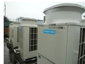
【高効率パッケージ空調機】