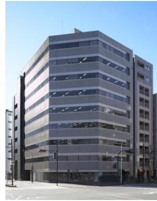
建物外観(KDX浜町中ノ橋ビル)

名称:KDX浜町中ノ橋ビル 所在地:東京都中央区 施工:清水建設(株) 設計:清水建設(株) 事業者等:ケネディクス不動産投資法人 ケネディクス・オフィス・パートナーズ(株) 竣工:1988年 建物構造:SRC造 地上9階 延床面積:3,280.41m 2