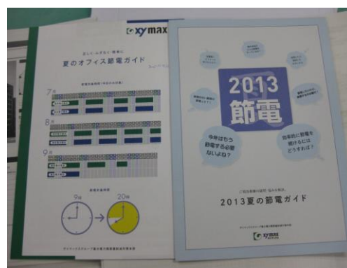
(テナント配布用節電ガイド)