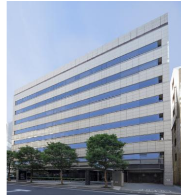
建物外観(KDX八丁堀ビル)

名称:KDX八丁堀ビル 所在地:東京都中央区 施工:鹿島建設(株) 設計:鹿島建設(株) 事業者等:ケネディクス不動産投資法人 ケネディクス・オフィス・パートナーズ(株) 竣工:1993年 建物構造:SRC造 地上8階 地下1階 延床面積:4,800.43m 2