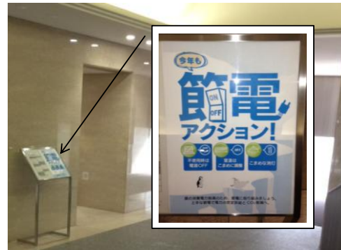
（節電ポスターの掲示）