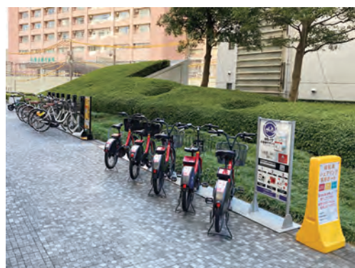
公開空地（小田急サザンタワー）のポート