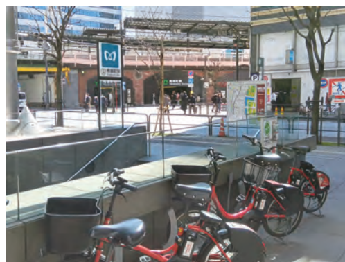
駅（有楽町駅）前のポート

ポートは、駅、公園、歩道上、店舗の前、マンション、公開空地など多くの場所に設置されています。