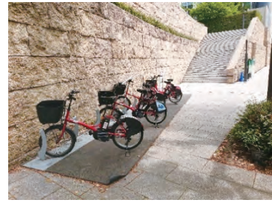
施設へのポート設置例（愛宕グリーンヒルズ）