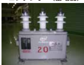
コンデンサー(蓄電器)

※1994年以降であっても、ユーザーによる絶縁油の入替え等によりPCB汚染されている可能性があるため、必要に応じて分析を行ってください。