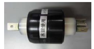
回転式接続コネクタ(表示あり)