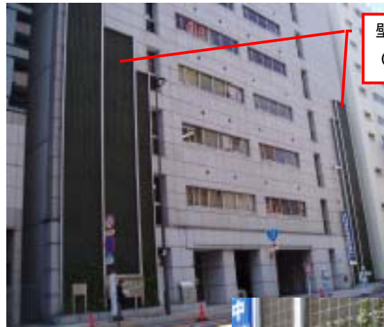
壁面緑化資材 (パネル)