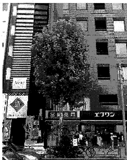
平成 29 年夏期剪定後