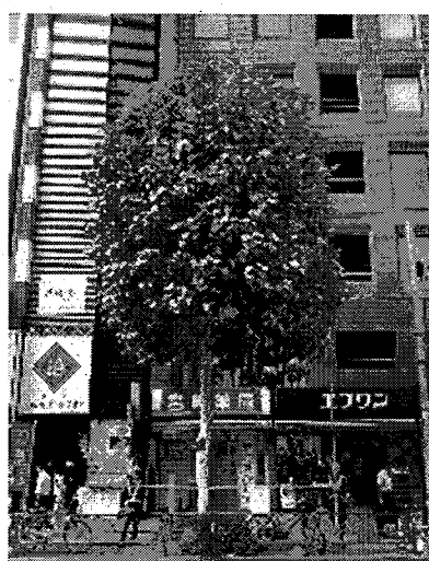
平成 30 年夏期剪定後