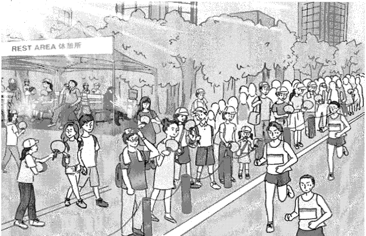
路上競技沿道対策イメージ図