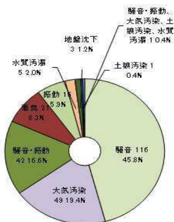
現象別内訳(合計 253 件)