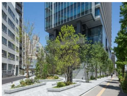
ビルトップガーデンウエスト

維持管理についても、基本的に化学薬品を使用しない病虫害防除、施肥を行い、オフィスワーカーや来訪者、生きものに影響を与えないよう配慮を行っています。