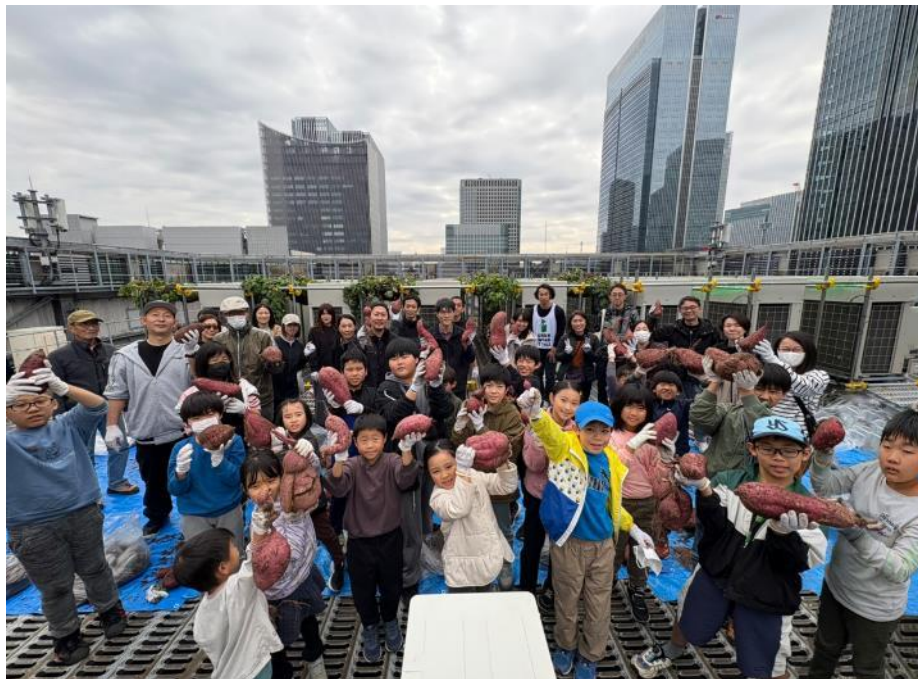
収穫した芋を持って記念撮影。後ろが、エアコン室外機の間にある栽培畑