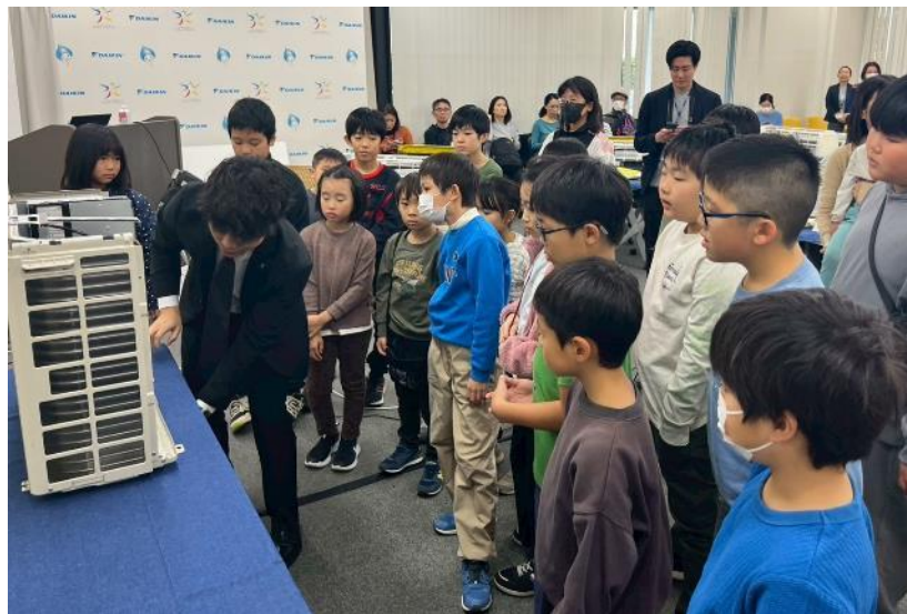
エアコン分解について説明を受ける様子