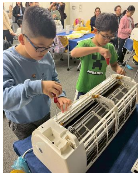
分解を行うこどもたちの様子