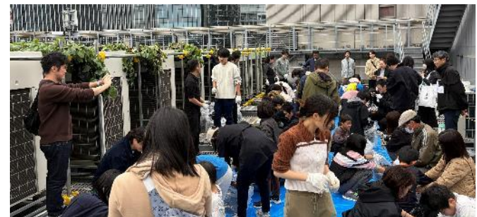
イベント全体の様子（↑）と芋ほりの様子（↓）