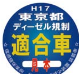
九都県市指定 粒子状物質減少装置ステッカー