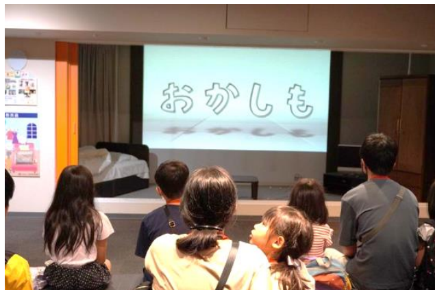
火災時の避難方法もお勉強しました。