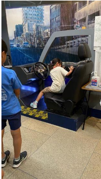
浸水して水圧がかかっている車のドアはとても重かった！