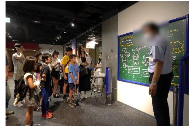
体や着ている服へ火がついた時、どうしたらいいのかも教えていただきました。