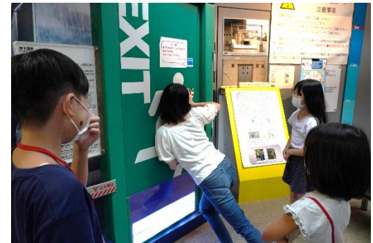
浸水して水圧がかかっている扉を全身で押している様子です。