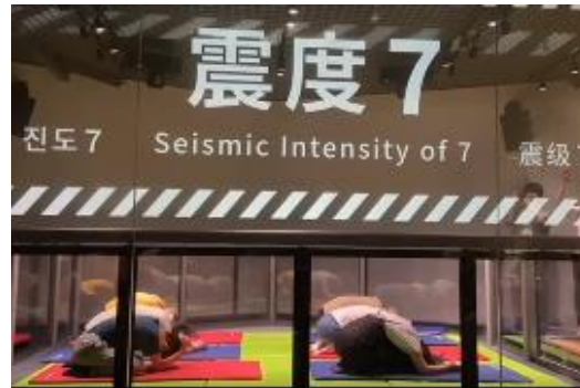
震度7の地震の揺れ具合を体験（学んだ“ダンゴムシ・ポーズ”でがんばる！）