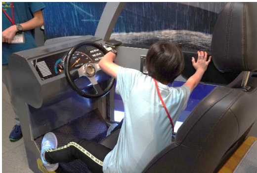
浸水して水圧がかかっている車のドアをがんばって開けてみました！