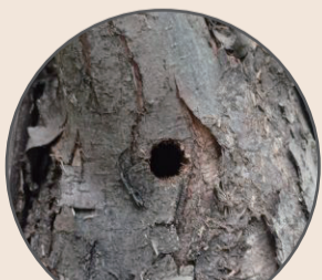
成虫が脱出した穴