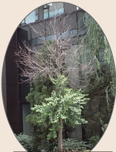
上部だけ枯れたカツラ

ツヤハダゴマダラカミキリは、アキニレ、カツラ、トチノキ、ヤナギなどを食い荒らしてしまう虫です。 上のほうだけが枯れた木があれば、ツヤハダゴマダラカミキリが潜んでいるかも！