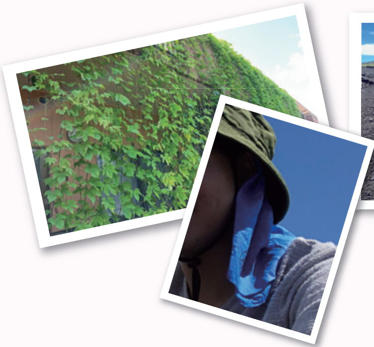
例：グリーンカーテン、暑さ対策の 服装の工夫 など

熱中症は、重症化したり、最悪の場合、命に関わることもあります。しかし、正しい対策を知っていれば防ぐことが可能です。東京都では、日常生活で簡単にできる熱中症対策を実践している事例の写真を募集しています。暑い夏をご一緒に乗り切るために、皆さまの工夫やアイデアを教えてください！