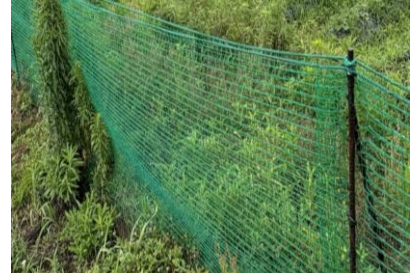
誘導柵：高さ130 cm程度の 緑色の網