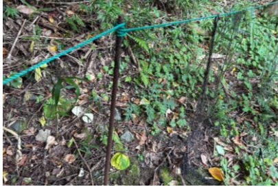
張り網：高さ70 cm程度の 黒色の網