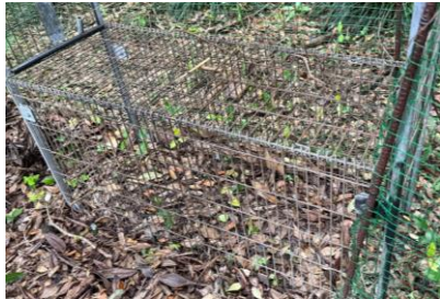
箱わな：高さ50 cm程度で箱型