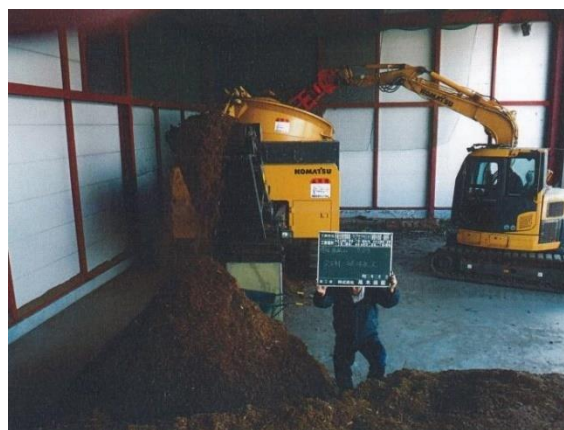
搬出した被害木のチップ化作業