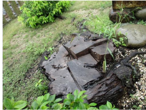
塗布処理した切株