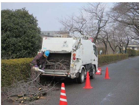
伐採した被害木の搬出作業