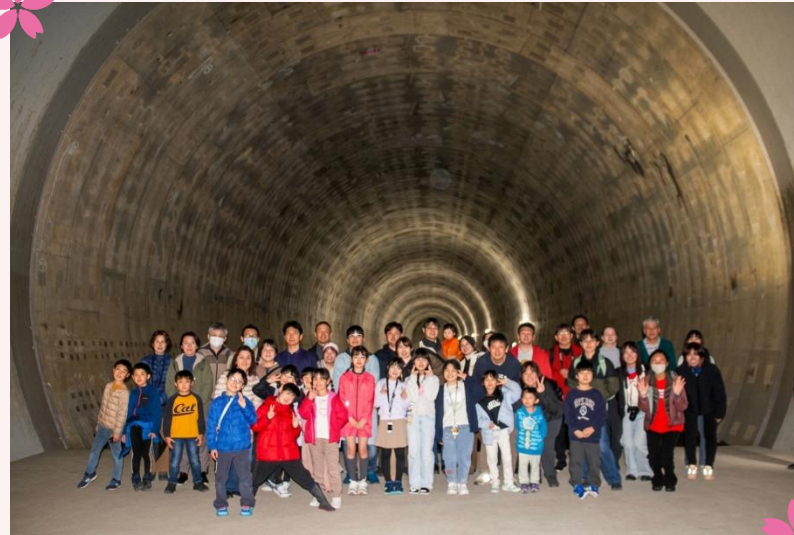
トンネルツアー最深部で記念撮影。地上では桜が咲いていたよ。