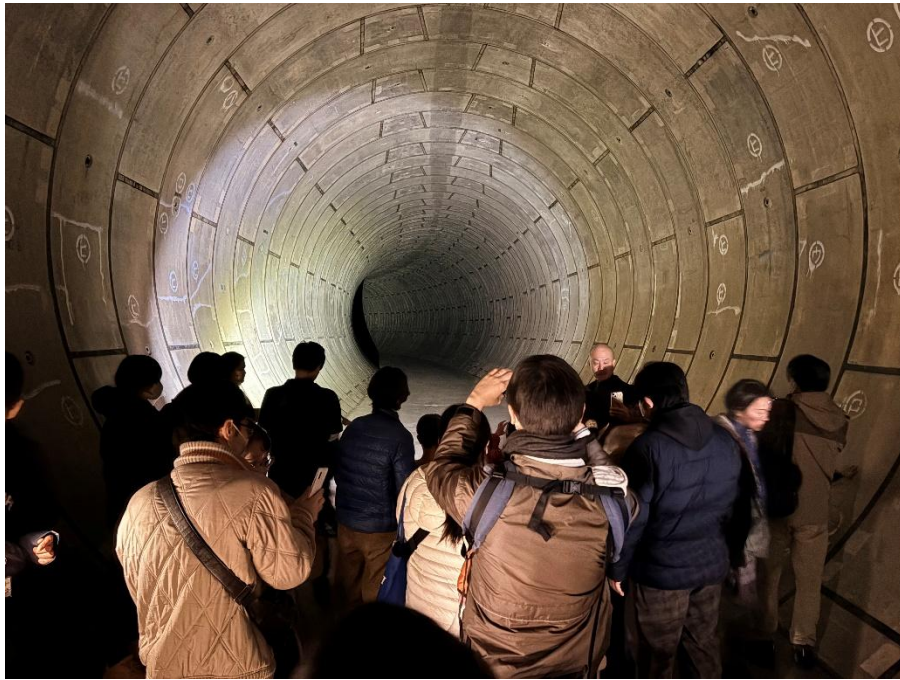
トンネル探検は、こどもたちだけでなく、 パパもママも、おじいさんもおばあさんも、みんなわくわく！