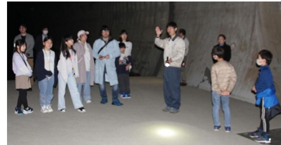
トンネルの中でも、職員の方に いろんなことを教えてもらったよ！