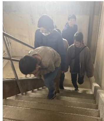
トンネルの見学が終わった後も、 みんなでがんばって 約200段の階段を上ったよ！