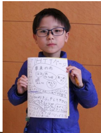
一緒に参加したみんな で、エコバッグの中 に入っていた自由帳に、 この日にわかったこと や調べたことを たくさん書いたよ！