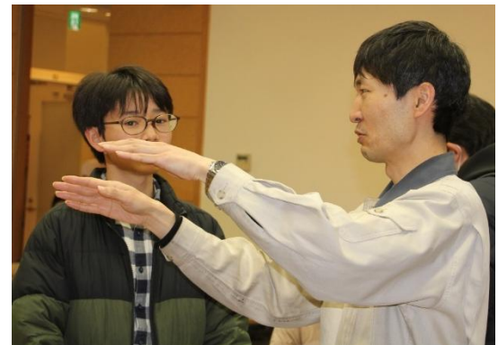
ツアー終了後も、熱心な参加者からたくさんの 質問が。職員の方にはとてもわかりやすく 丁寧に答えていただきました。 本当にどうもありがとうございました！