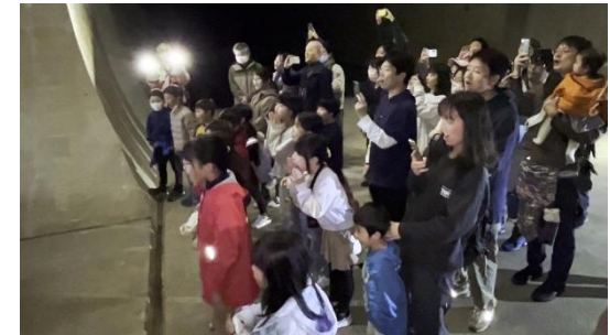
トンネルに向かってみんなで「ヤッホー！」 大きなやまびこにびっくりしたよ！