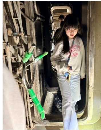
潜水艦のような大きなバルブの ついた扉を通してトンネルへ