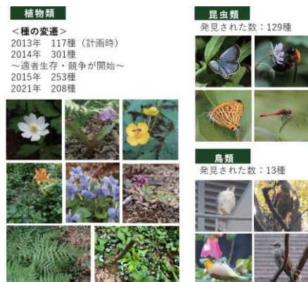
生物多様性の保全

さらに、土壌の保水量は理論値で約275㎡、雨水貯水槽の容量は約760㎡と、雨水の貯留により災害激甚化にも対応し、貯留した水は植栽への灌水等に循環利用している。また、テナント等の地域関係者と連携し、大手町の森で採取した苗木を育成する「苗木プロジェクト」等、環境に関する啓蒙活動にも注力している。