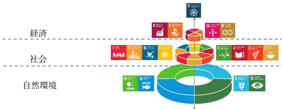
【出所】 Stockholm Resilience Centre

SDGsのウェディングケーキは、私たちの暮らしや経済活動が、自然環境の上に成り立っていることを端的に示した図といえる。インターンシップの受入団体はどの目標と関わりが深く、その目標はどのような自然環境との関わりが深いかを考察する。