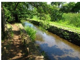
矢川緑地保全地域