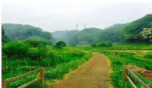
横沢入里山保全地域