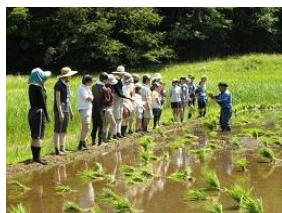
田植え作業の指導