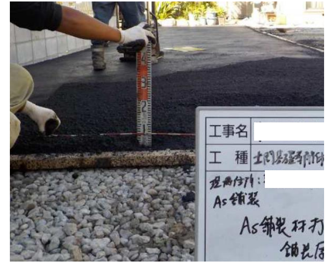
アスファルト舗装 5 cm以上で施工

土地所有者は事業者に賃貸していた土地の返還を受けた。 土地所有者は土壤汚染対策法3条に基づき調査をしたところシアン（溶出）、ふっ素（溶出）の土壤汚染が確認された。 土壤汚染は残置し、アスファルト舗装により飛散防止を実施。