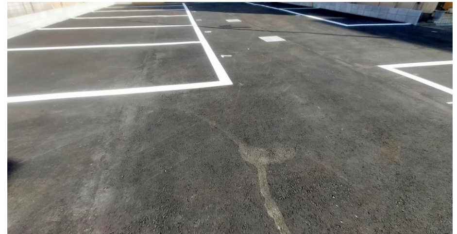
施工後（アスファルト舗装）