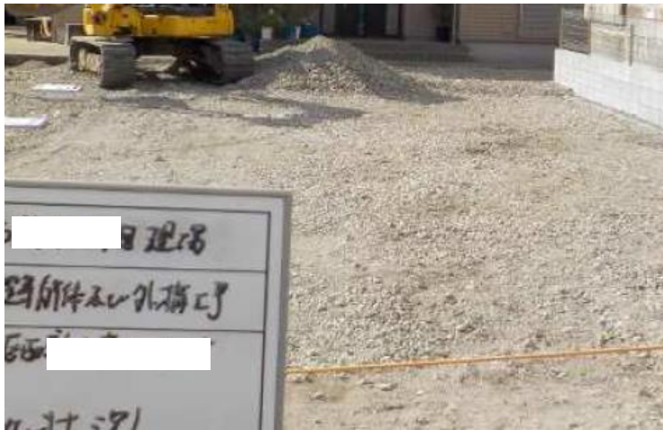
施工前（砕石敷均し）