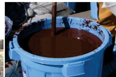
注入薬剤(吸着剤・酸化鉄微粒子)