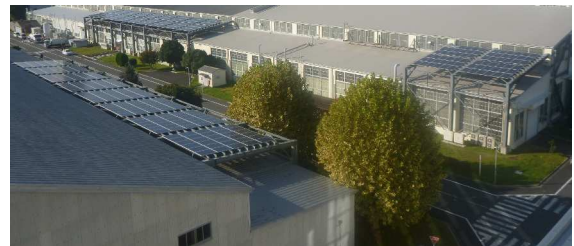
太陽光発電(事業所内 13 箇所で開催)