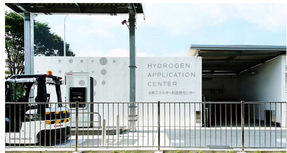
水素ステーション(太陽光と水から水素をつくり使用)