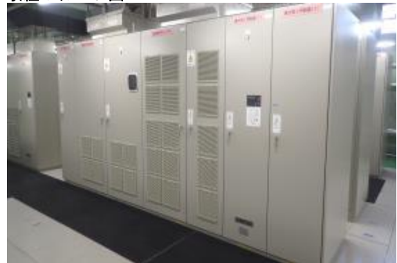
図1 送水ポンプ用インバータ装置