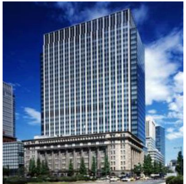
＜明治生命館(手前)と明治安田生命ビル＞