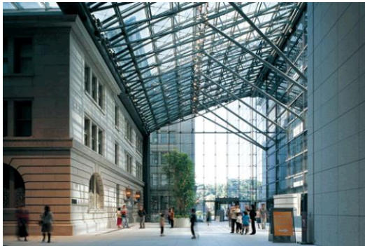
＜新旧建物を結ぶアトリウム＞

本建築物は、重要文化財に指定された“明治生命館”の保存再生と“明治安田生命ビル”の新築を行い、最新技術を備えた“超高層建築物”と“歴史的建造物”の共存を目指し 2005 年に竣工した。