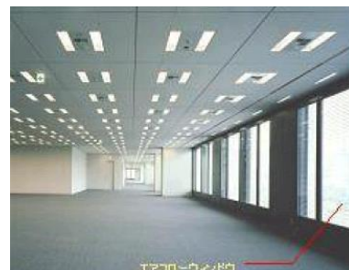
＜基準階 エアフローウィンドウ＞