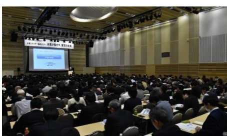
（ 水素エネルギー推進セミナーの様子 ）