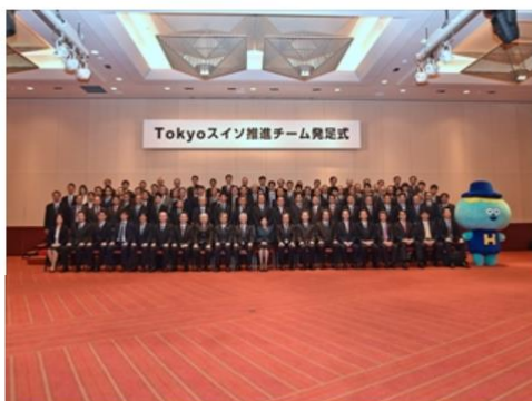
発足式の様子

東京商工会議所は、東京都が11月1日に発足させた「Tokyoスイソ推進チーム」に参加しました。「Tokyoスイソ推進チーム」は、水素エネルギーの普及に向け、東京都・都内自治体・民間企業等111団体が「官民両輪」によるムーブメントを醸成すべく、取り組むものです。