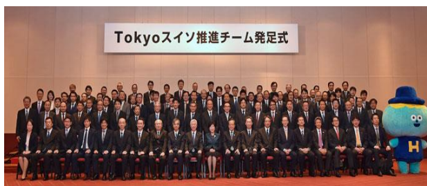
（ Tokyo スイソ推進チーム発足式の様子 ）