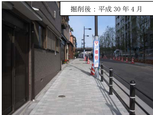
掘削後：平成 30 年 4 月