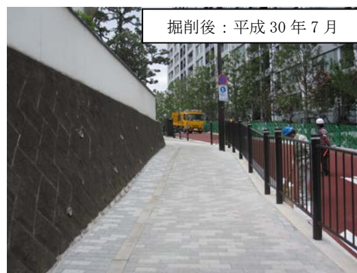
写真 2-2 現地踏査状況