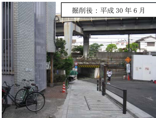
掘削後：平成 30 年 6 月