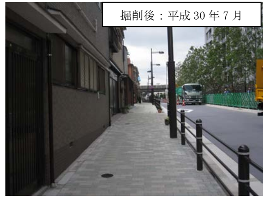
掘削後：平成 30 年 7 月