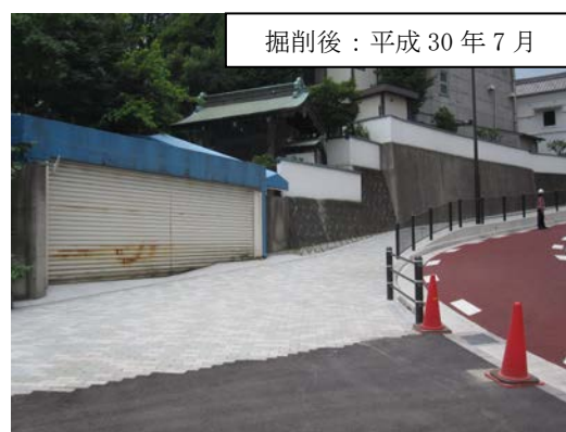
写真 2-1 現地踏査状況