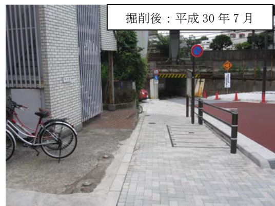
掘削後：平成 30 年 7 月