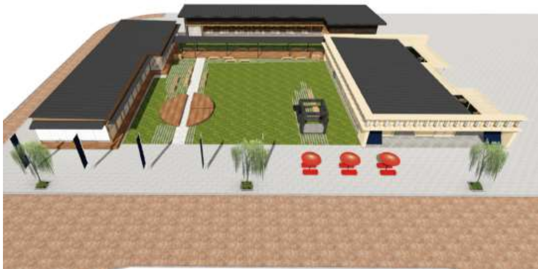
図 1-2 場外マルシェ（暫定施設）のイメージパース（補助315号線より）

なお、その後に建設予定の千客万来施設2の施設規模は現時点では未定であるため、施設規模等が確定した段階で、必要な手続きを行う。