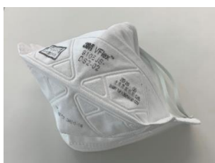
使い捨て防じんマスク例 (規格 DS2)