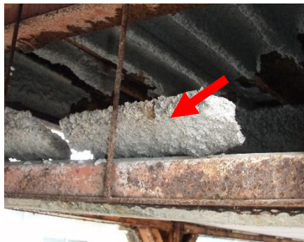
落下した吹付け材