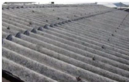
アスベスト含有スレート（波板）