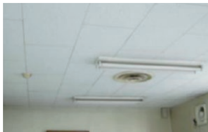
アスベスト含有化粧ボード（天井）